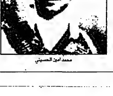
محمد أمين الحسيني